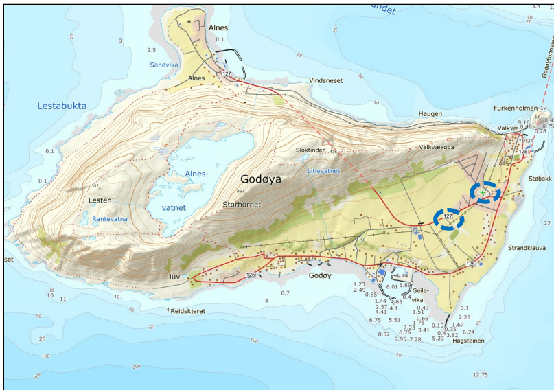
Figur 2 Lokalisering av planområdet på Godøya, markert med blå avgrensing.

Planområdet er to områder på Godøya, eksisterende barnehage på Valkvæ (gnr./bnr. 124/378) og ny barnehage tomt ved Godøy stadion (gnr./bnr. 124/55).