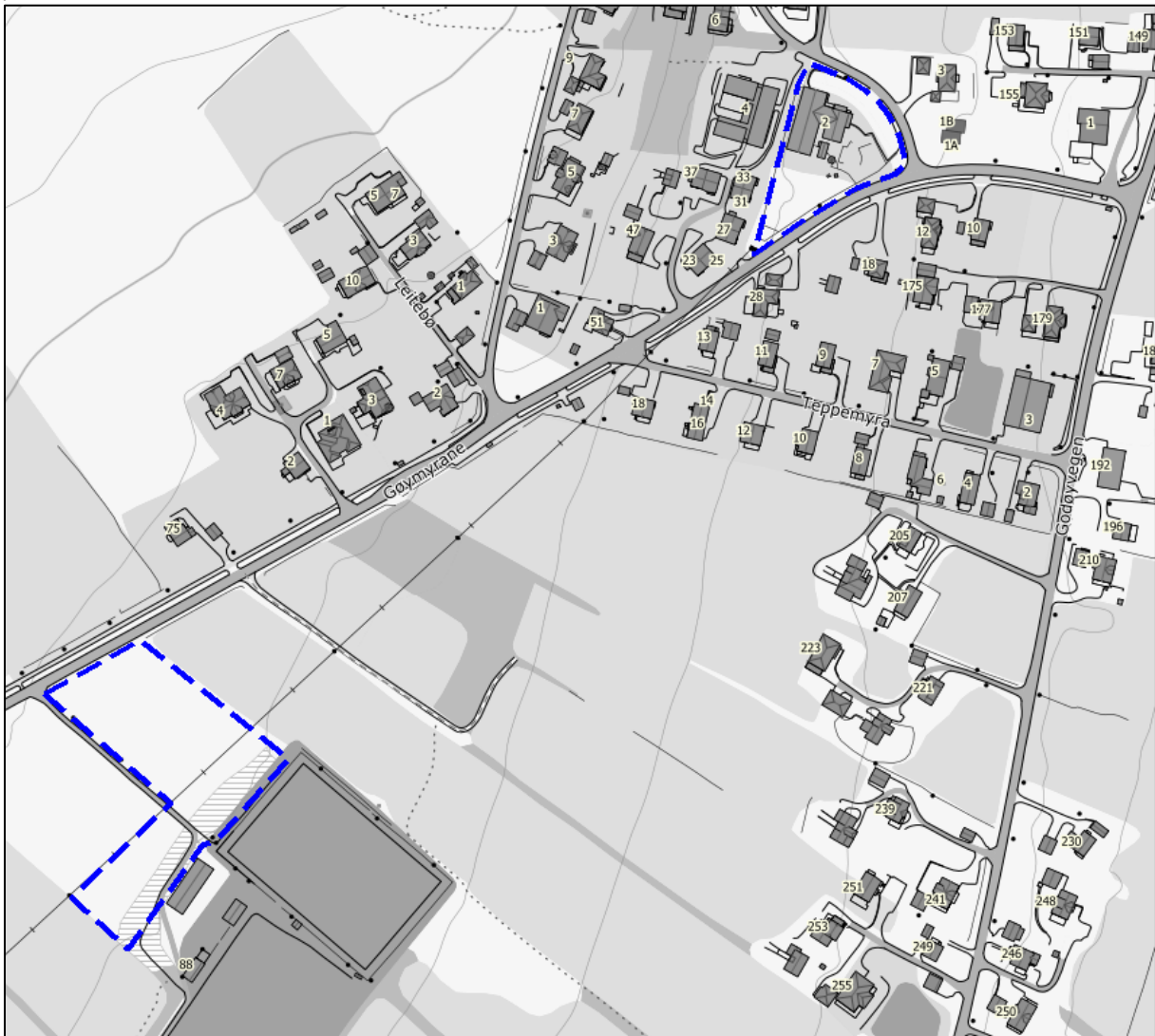
Figur 1 Framlegg til plangrense, ny barnehage ved Godøy stadion og gamle Tryggheim barnehage i aust, Godøya

Etter forskrift om behandling av private forslag til detaljregulering etter pbl. skal det utarbeidast planinitiativ til kommunen seinast samtidig med førespurnad om oppstartsmøte etter pbl. § 12.8. Planinitiativet skal i nødvendig grad omtale premissane for det vidare planarbeidet, og gjere greie for punkta under.